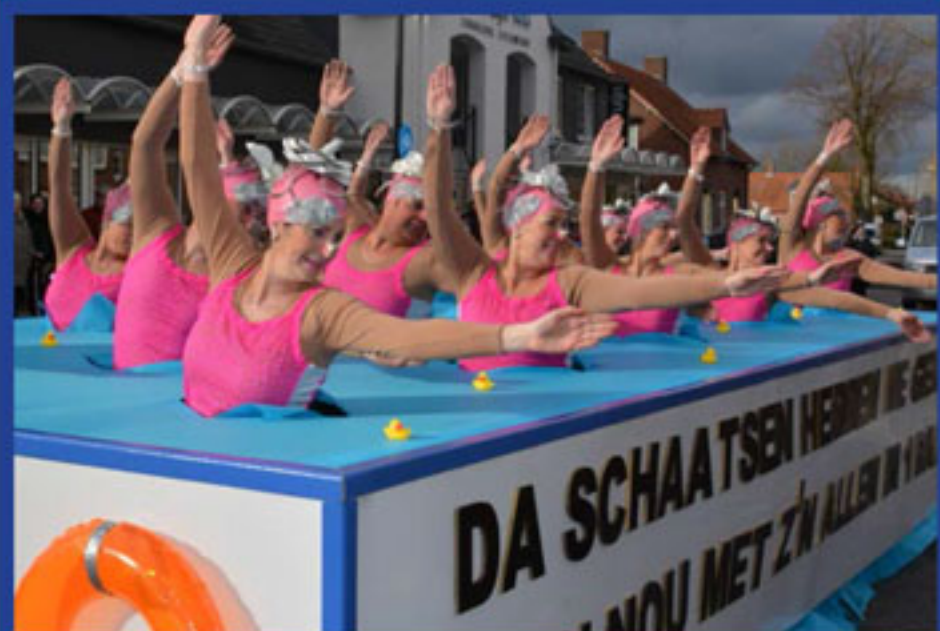
NR 1 Loopgroepen + Aanmoedigingsprijs + Publieksprijs in de categorie loopgroepen, duo's en solo's De Droge Sneekes.