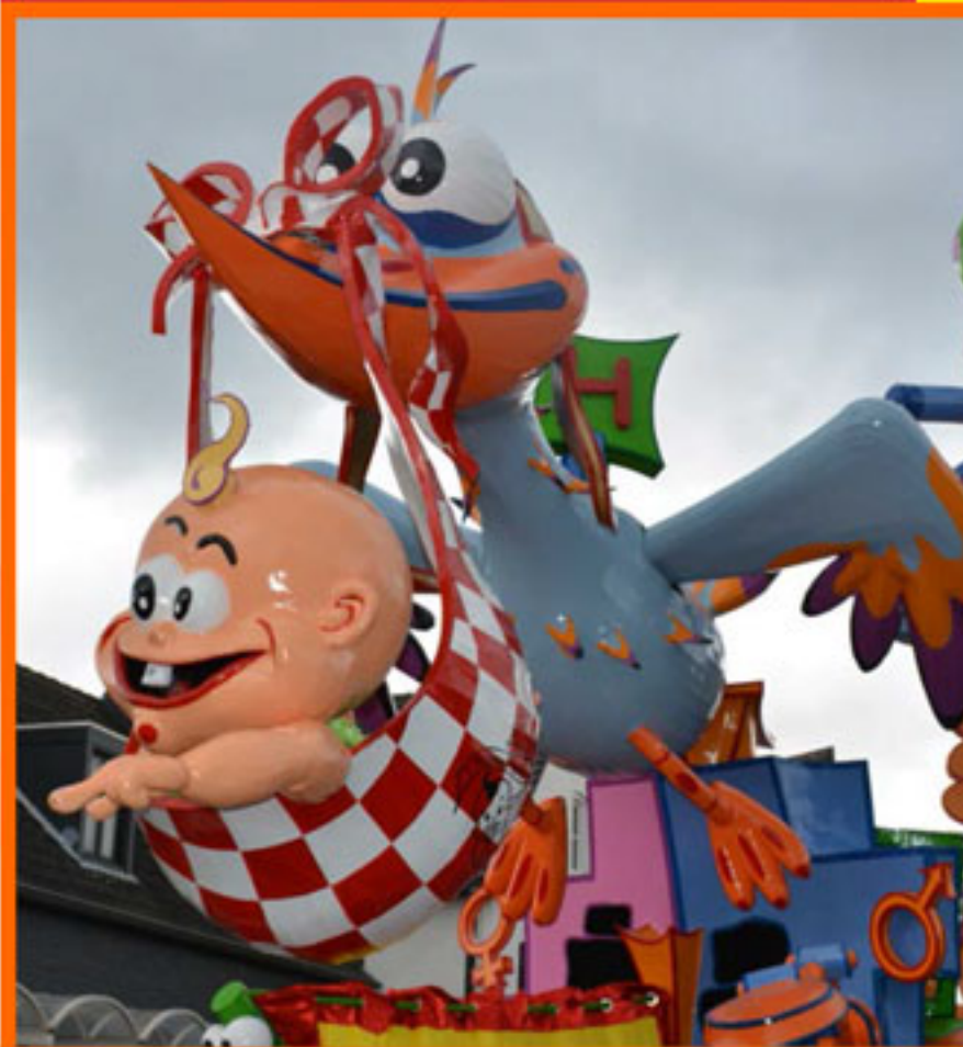
NR 1 Wagens + Publieksprijs Wagens J.V. 't Brouwersgilde