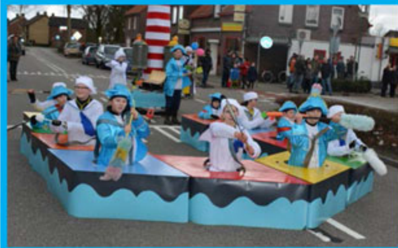
NR 1 Narrentieners - De Zottekes