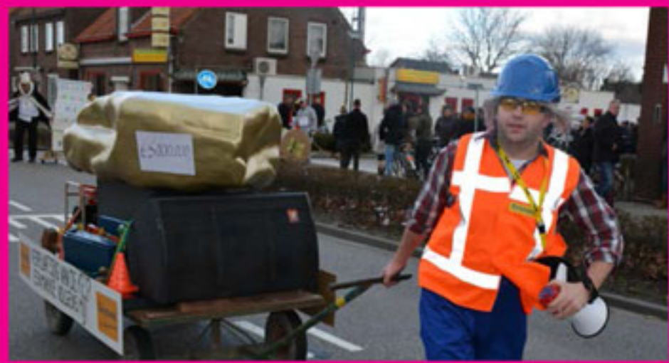
NR 1 Solo's - Bouwbedrijf Keijmans