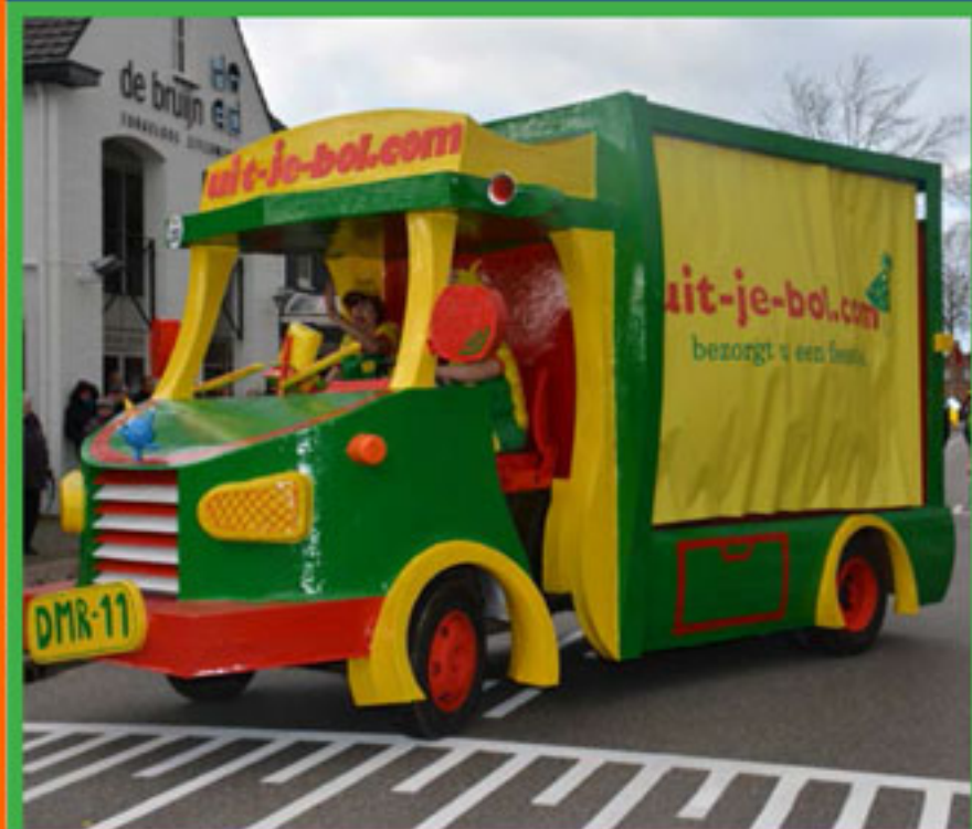
Meest carnavaleske idee C.V. De Mouwers